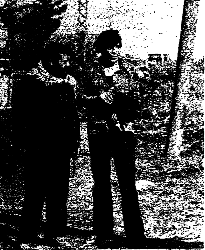
شظية من إحدى القذائف